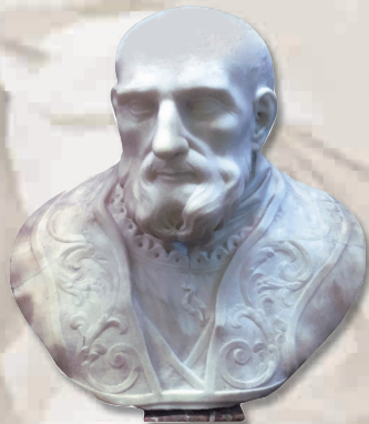
San Filippo Neri

Nel 1874, in seguito alla legge relativa alla soppressione delle corporazioni religiose e all'incameramento del loro patrimonio, la Biblioteca Vallicelliana passa al demanio, divenendo una biblioteca pubblica statale, prima alle dipendenze del Ministero della Pubblica Istruzione, poi quale istituto periferico del Ministero dei Beni e delle Attività Culturali e del Turismo. Dal 1883 ospita nei suoi locali la Società Romana di Storia Patria con il relativo patrimonio.